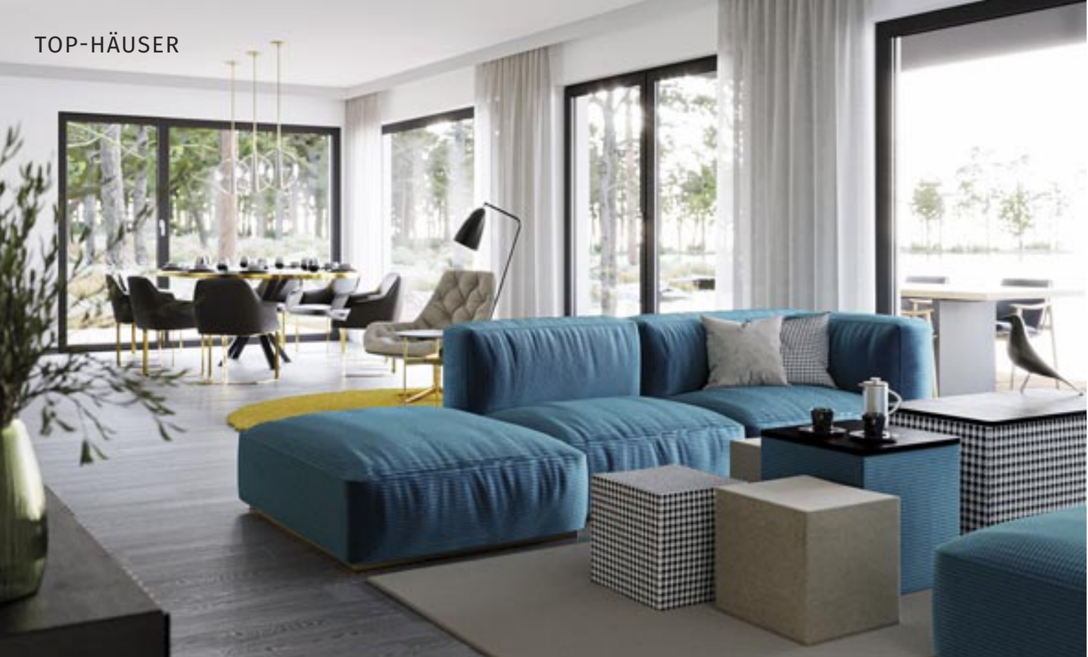
Scheinbar übergangslos weiten sich Wohnbereich und Essplatz mit ihrer bodentiefen Verglasung in die Natur aus.

Bien-Zenker-Häuser sind ab Ausbaustufe „zur Ausstattung fertig“ im Gold-Standard der Deutschen Gesellschaft für Nachhaltiges Bauen zertifiziert