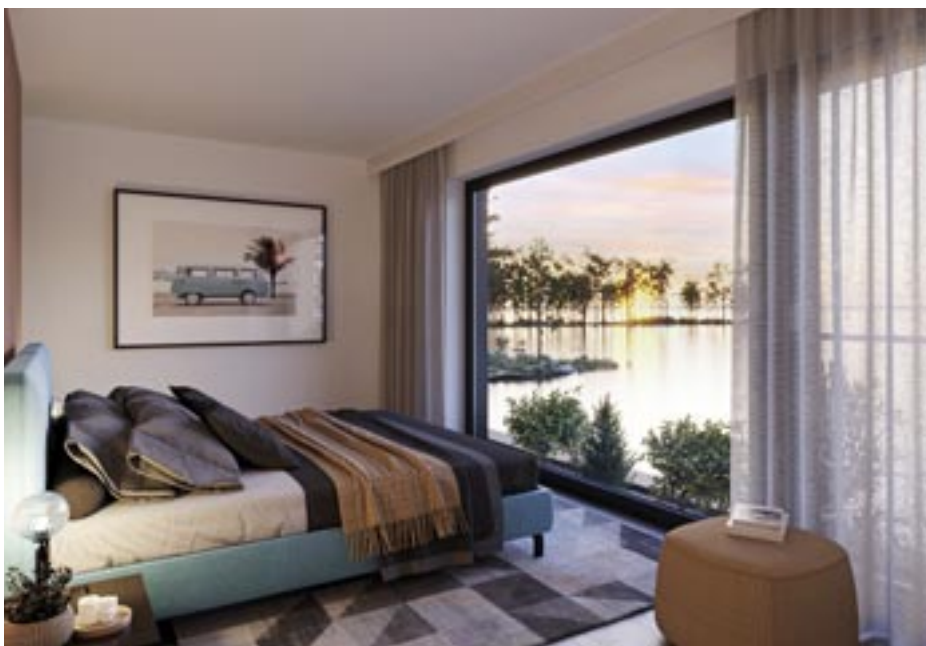
Vom Bett aus lassen sich traumhafte Aussichten genießen. Hinter dessen Rückwand: Ankleide und Bad.

Die Treppe ins Obergeschoss endet vor der Glastür zur Dachterrasse. Ein großes Flachdachfenster flutet die Galerie zusätzlich mit Tageslicht. Die Aussichtsseite des Hauses teilen sich der Rückzugsbereich der Eltern mit Ankleide, Bad und Sauna sowie eines von zwei Jugendzimmern. Das ist nicht nur wegen seiner (optionalen) Aussicht, sondern auch wegen seiner enormen 22 Quadratmeter bemerkenswert. Gegenüber liegen ein Duschbad und ein weiteres Arbeitszimmer, das wegen der komfortablen Nähe des Bads jedoch auch für Gäste prädestiniert wäre.