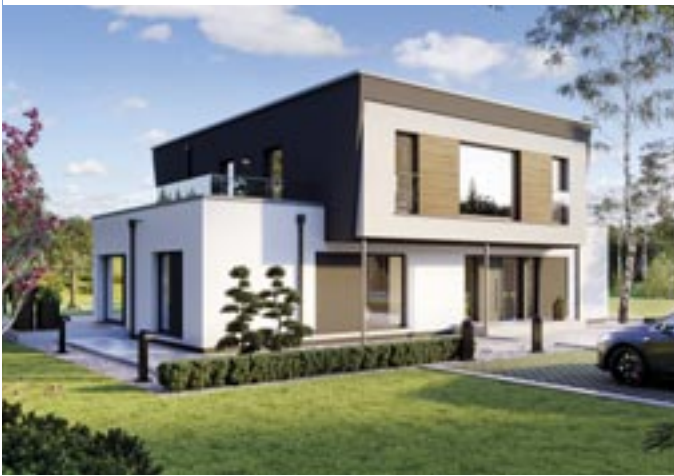
Zwei gestapelte Quader definieren den Baukörper. Die freien Dachflächen sind als Terrassen ausgebaut.

Neues Musterhaus in Bad Vilbel | Die imposante Villa wirkt dank Staffelgeschoss eher leicht. Der Entwurf scheint nur darauf zu warten, sich auf eine spektakuläre Aussicht auszurichten