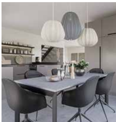
So könnten Koch- und Wohnzone des Planungsbeispiels mit den hellgrünen Erkern aussehen.

Die Grundrisse beider Beispiele sind offen und funktional. Der Eingang befindet sich jeweils auf der Giebelseite. Empfangen werden Bewohner und Gäste von einer großzügigen Diele mit angrenzender Garderobe. Über einen breiten Durchgang gelangt man in die fließend ineinander übergehenden Gemeinschaftsräume. Der lichtdurchflutete Platz im Erker mit zauberhafter Aussicht in den Garten bietet sich für einen großen Esstisch an. Direkt neben dem Eingang befindet sich ein Arbeitszimmer, das konzentriertes Arbeiten verspricht. Im Dachgeschoss gruppieren sich um eine Galerie zwei Kinderzimmer, ein Schlafzimmer mit Ankleide und ein großes Familienbad mit Wanne und Dusche. Auf Wunsch kann das Bad verkleinert werden. So entsteht ein zusätzliches Bad en-suite für die Eltern. ■