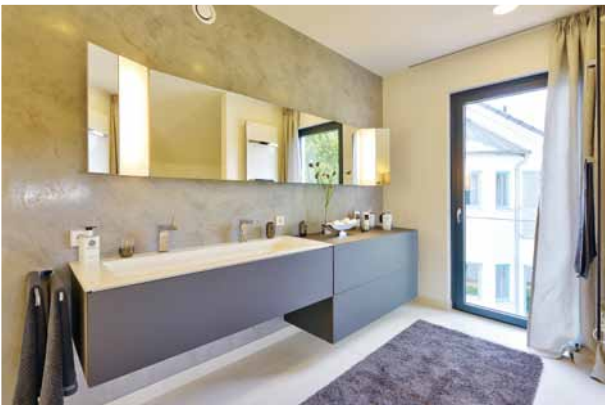
Viel Licht gehört ins Wellnessbad. Ein zweites großes Fenster gibt's über der Wanne.