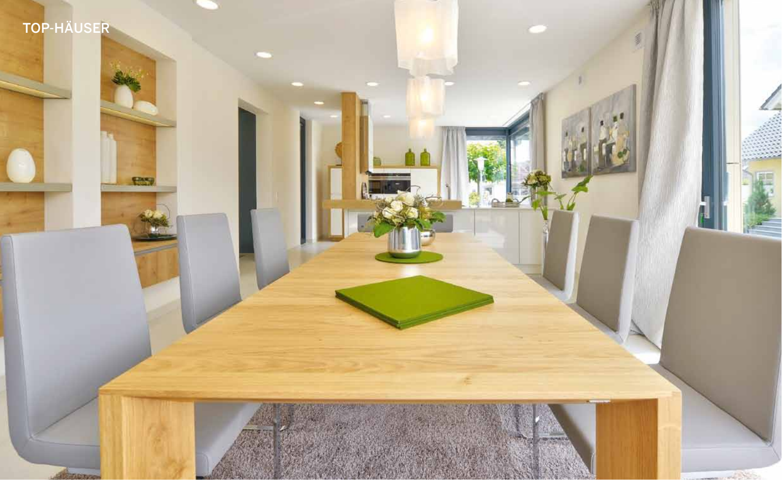
Die Wände des Essbereichs sind als Regale nutzbar. Abends sorgen sie mit Licht für Atmosphäre.

Unten offenes, kommunikatives Wohnen , oben komfortabler Rückzug für alle Familienmitglieder