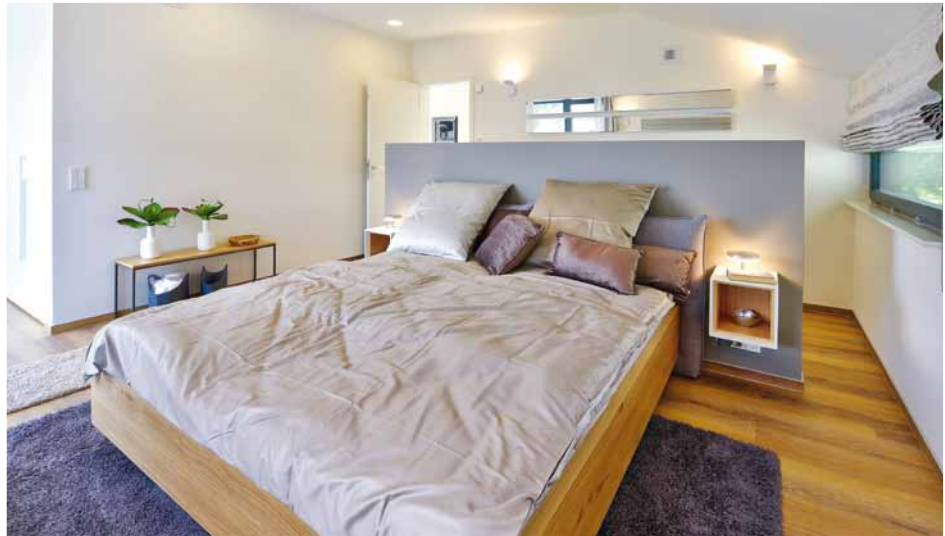
Hinter der Wandscheibe haben Wäschekommoden Platz. Die Schränke sind links um die Ecke eingebaut.

Unten offenes, kommunikatives Wohnen , oben komfortabler Rückzug für alle Familienmitglieder