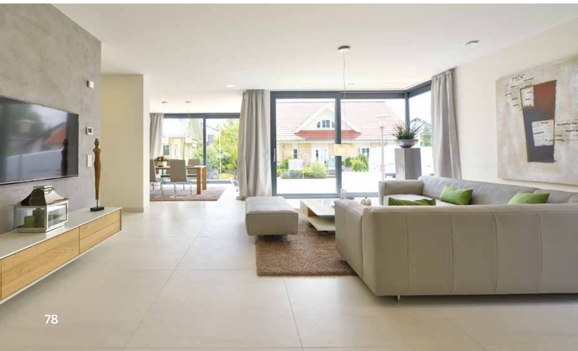
Anschluss zum Garten sind raumhohe Übereckverglasungen, die sich aufschieben lassen.